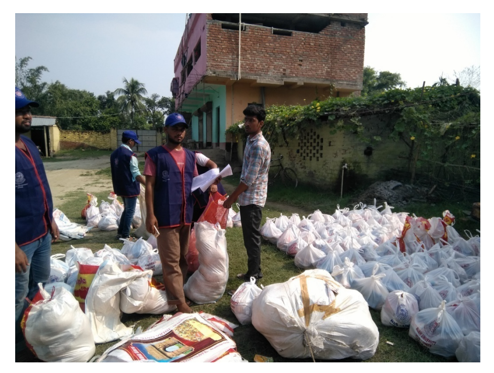
NSS Volunteers are busy to Packed the Relief Materials for Flood Victims at Camp