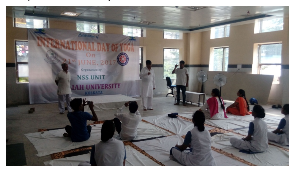
Hon'ble Vice-Chancellor delivering speech during International Day of Yoga on 21st June, 2017

increasing life expectancy. It keeps the physician away and helps various parts of the body perform their functions smoothly in proper coordination. It strengthens the immune system and does internal cleansing of blood, body parts, body systems, organs, veins & arteries. It brings a divine glow on the face and makes us wise. Yoga trainer also discussed so many benefits of yoga and also performed so many activities.