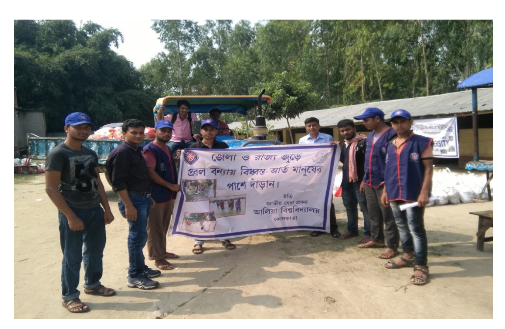
NSS Volunteers are Ready to Move for Distribution of Relief Materials to Flood Victims