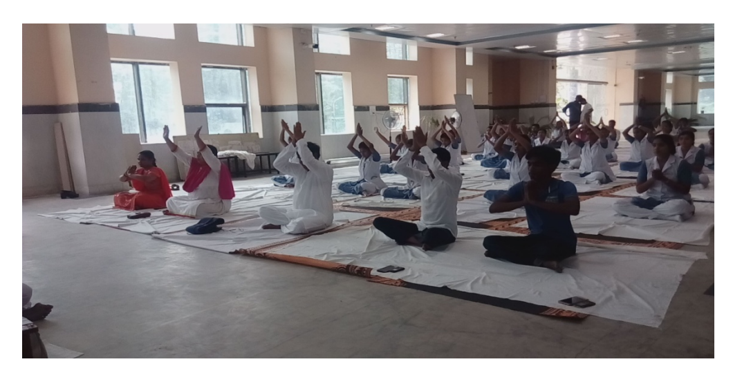
Hon'ble Vice-Chancellor, Programme Co-ordinator, NSS and Volunteers, Students performing Yoga during International Day of Yoga on 21<sup>st</sup> June, 2017