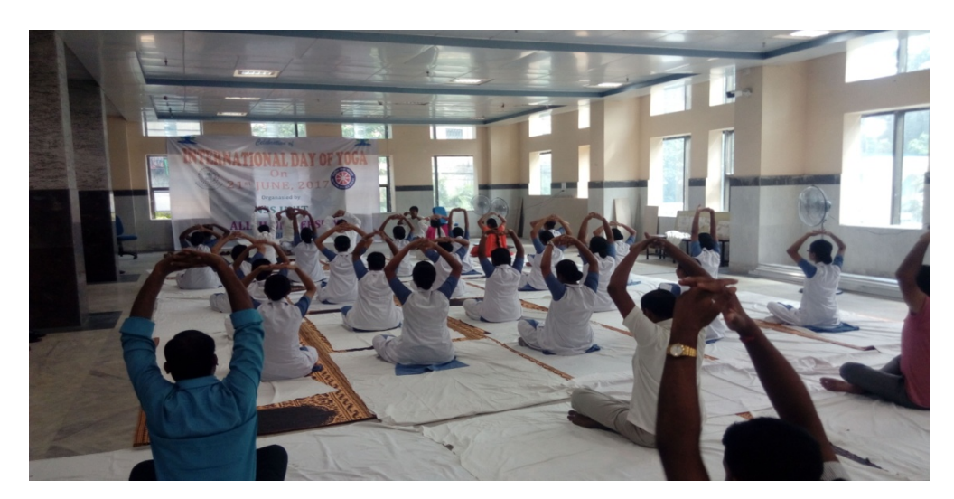
Students, Volunteers performing Yoga during International Day of Yoga on 21st June, 2017