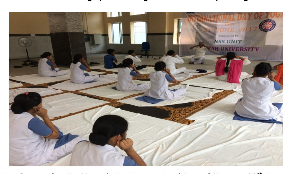
Yoga Teacher performing Yoga during International Day of Yoga on 21st June, 2017