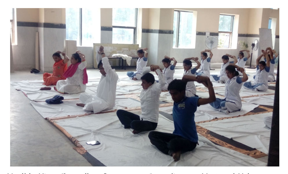
Hon'ble Vice-Chancellor, Programme Co-ordinator, NSS and Volunteers, Students performing Yoga during International Day of Yoga on 21<sup>st</sup> June, 2017