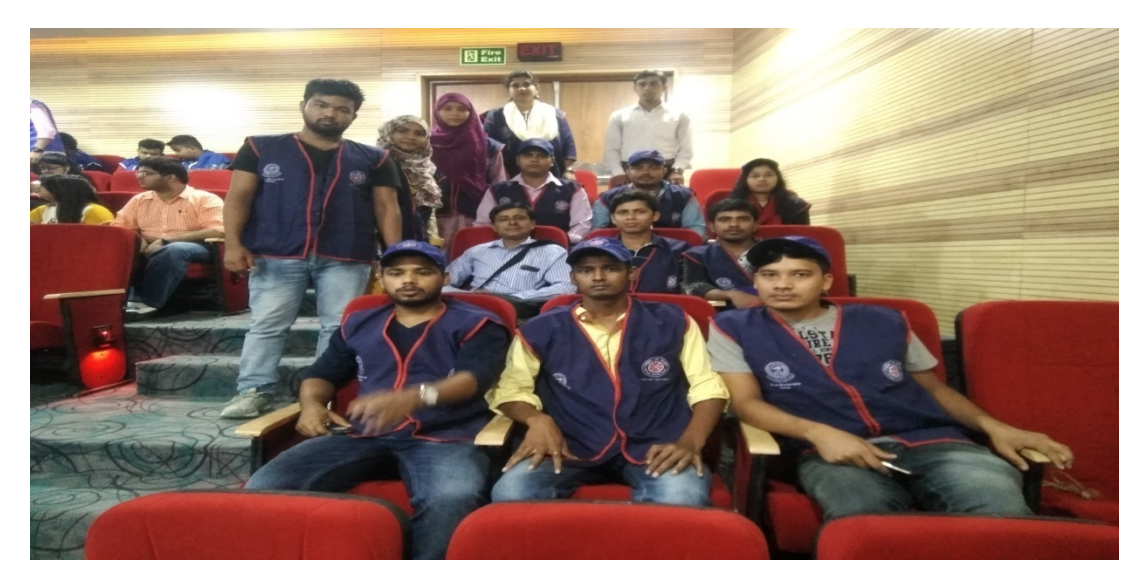
NSS Volunteers and Programme Co-ordinator, NSS attending for Interaction session with Honorable Union Minister, Ministry of Youth Affairs & Sport, at Amity University